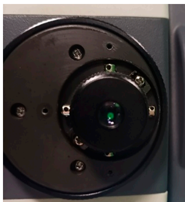
Рис. 2. Устройство системы крепления сетки нитей у тахеометра EFT TS1 Примечание: составлен авторами по результатам данного исследования

места нуля. Значение места нуля возможно обнулить. Значение места нуля, согласно руководству по эксплуатации 2 , не должна превышать \pm 10'' . Сетка нитей тахеометра закреплена при помощи четырех юстировочных винтов (рис. 2). Диапазон ее наклона в вертикальной плоскости составляет 0^{\circ}16'26'' (измерения получены с СКП 0^{\circ}00'55'' ).