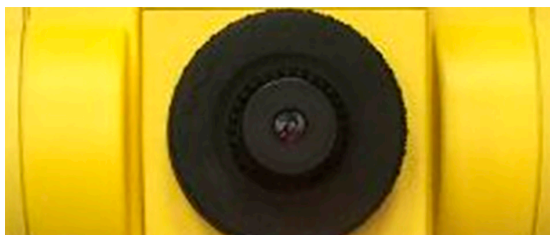
Рис. 3. Окуляр тахеометра Leica Builder 509 Примечание: составлен авторами по результатам данного исследования

Рассмотрим тахеометр Leica TS06 (5"). Этот тахеометр также исследовался в работе Д. А. Гура [15, с. 160]. Согласно этой работе, максимальная амплитуда измерения углов у этого тахеометра составляет 1,9'. Поэтому этот тахеометр можно считать достаточно точным. Диапазоны тахеометра на каждое из двух измерений для определения места нуля не превышают \pm 4^{\circ}30'00'' . Допуск на окончательное значение места нуля не может превышать \pm 0^{\circ}05'23'' . В руководстве по эксплуатации 4 расстояние до цели для проведения поверки составляет около 100 м, максимальный вертикальный угол для каждого из двух измерений для проведения поверки составляет \pm 5^{\circ} . Предельное допустимое значение места нуля в руководстве по эксплуатации 4 не указано. У тахеометра возможно открутить окуляр, но это не даст возможности юстировки сетки нитей. Сетка нитей закреплена тремя винтами (рис. 4).