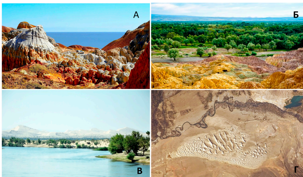
Рис. 1. Участки озерной равнины: А – в Зайсанской впадине; Б – в Джунгарской котловине; В – золотые пески дельты и террас Пра-Иртыша в уезде Бурунчи; Г – пески на левом берегу Иртыша в уездах Хабахэ и Бурчун Примечание: составлено авторами по результатам данного исследования

Пластовые равнины характеризуются наличием в фундаменте глинистых слоев раннего и среднего кайнозоя, на протяжении которого в Джунгаро-Зайсанской межгорной котловине существовал водоем значительно больших размеров, чем современное озеро Зайсан. После его регрессии сформировалась озерная равнина (рис. 1. А, Б), сложенная глинами, гипсом, суглинками и песками с линзами соли. В фундаменте этих пород залегает мощный слой древних и новейших рыхлых отложений. Озерная равнина возвышается над урезом воды на 10-15 м и может достигать ширины более 30 км.