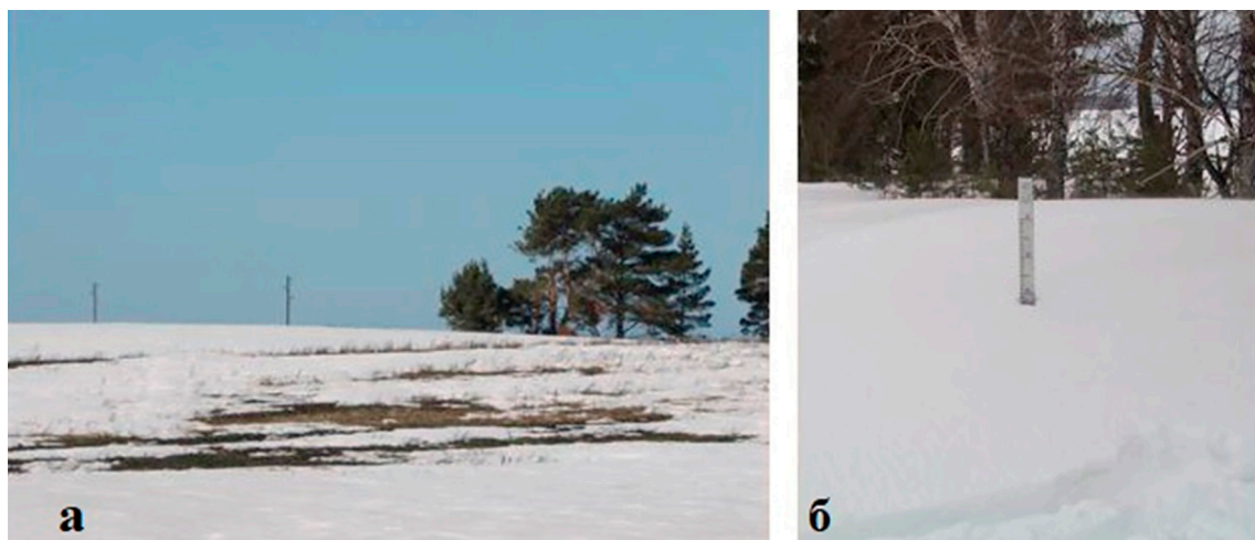
Рис. 2. Неравномерное залегание снежного покрова Лучановского полустационара в бассейне р. Басандайки: а – на плакоре пашни (март 2015), б – в сугробе у лесополосы (март, 2018)

Талая эрозия почв – сложный природно-социальный процесс, зависящий от сочетания ряда как природных, так и антропогенных факторов. Многолетние наблюдения на двух склонах пашни южной экспозиции полустационара «Лучаново» подтверждают сложность проявления процесса, так как при одних и тех же погодных условиях года смыв почв на разных участках склона пашни различается. В среднем за многолетние исследования запасы влаги в снежном покрове для пашни южного склона составили 142 мм [10], но разбиение этого ряда наблюдений на десятилетние промежутки позволило выявить крупномасштабные временные колебания: так за 1988–1997 гг. среднее значение влагозапасов составило 122 мм; за 1997–2007 гг. – 153 мм; за 2008–2017 – 152 мм и за 2018–2023 гг. – 114 мм. Но средние значения влагозапасов не отражают истинной картины этого показателя вследствие неравномерного залегания снежного покрова из-за деятельности метелей: толщина снежного покрова на пашне изменяется от 0 до 30 см (рис. 2, а) на наветренных выпуклых участках пашни – до 1,5–2,4 м в сугробах лесополос и в депрессиях рельефа (рис. 2, б).