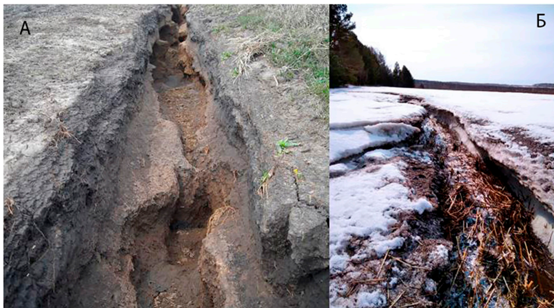
Рис. 3. Промоины с порожистым руслом на пашне ключевого участка в бассейне р. Басандайки: А – апрель 2021 г., Б – март 2022 г.

Такое явление, наряду с влиянием микро рельефа пашни и глубиной оттайки почв от 5 – 10 до 25–35 см, вызывает неравномерность смыва почв со склонов. Большое влияние на талую эрозию также оказывает крутизна склонов и интенсивность снеготаяния. За годы наблюдений она изменялась от 8,7–9,8 мм/сут (1997–1998 гг.) до 52,5 мм/сут, составляя в среднем 12,9–15,9 мм/сут. Наблюдения за скоростями воды в руслах микропотоков показали, что они изменяются от 0,01–0,5 до 1,5–2,0 м/с. Такие скорости способны подвергать размыву грунты, слагающие поверхность территории: допустимые неразмывающие скорости этих пород изменяются от 0,27–0,37 до 0,65–0,75 м/с. Скорости потока от 0,7–1,5 м/с на склонах крутизной 5–7° и более образуют промоины глубиной до 1,5 м с порожистым руслом (рис. 3). Наблюдения показали, что большое влияние на интенсивность развития талой эрозии оказывает состояние агрофона: наибольший смыв почвы происходит по боронованной зяби. В зависимости от длины, крутизны, формы склона, интенсивности снеготаяния, наличия ложбин, осложняющих склон, смыв изменяется от 1–5 до 20–26 м 3 /га.