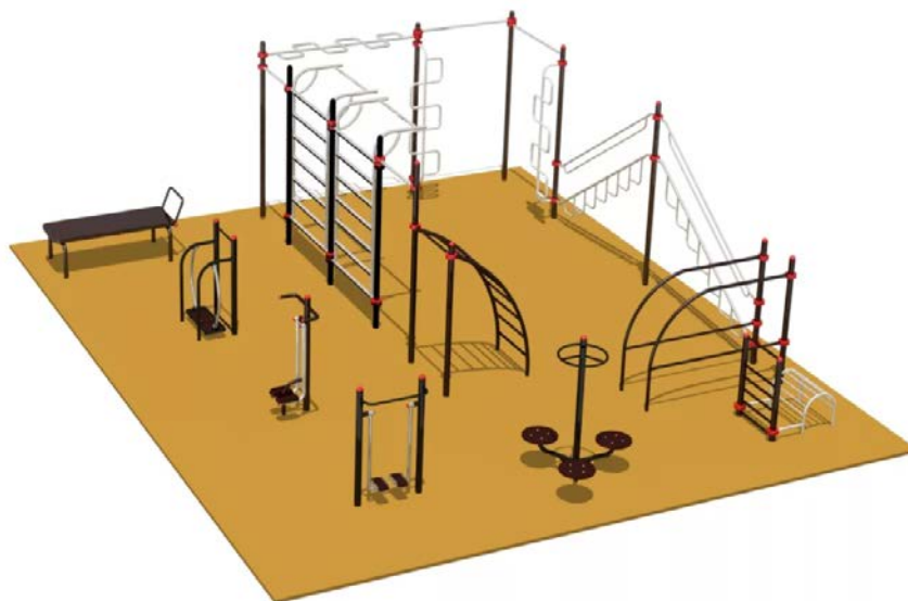
Рис. 2. Вариант организации спортивного комплекса в сквере Интернационалистов

Среди направлений по оптимизации проекта благоустройства сквера Интернационалистов предлагается предусмотреть спортивную площадку для занятия спортом на тренажерах, которая в настоящее время не заявлена в проекте. Рекомендуемая спортивная зона представляет собой комплекс спортивно-технологического оборудования – антивандальных тренажеров на все группы мышц: разноуровневые турники, брусья, шведская стенка, тренажер «Скамья для пресса», тренажер «Рукоход», тренажер «Жим от плеч». В качестве покрытия площадки рекомендуется использовать резиновую прессованную крошку. Кроме того, предполагается установить информационный стенд для правильного использования оборудования. Создание и установка комплекса будет производиться из современных материалов, позволяющих использовать спортивное оборудование круглый год. Размер спортивной площадки – 85 м 2 . Спортивная площадка будет находиться в свободном доступе для бесплатных посетителей. На рис. 2 представлен пример спортивного комплекса.