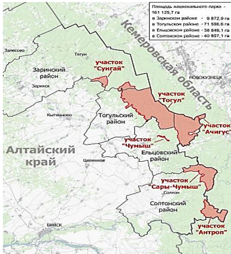
Рис. 1. Карта-схема национального парка «Салаир» [7]