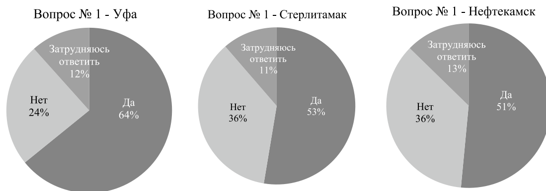
Рис. 1. Результаты первого опроса

По результатам первого опроса в Уфе хотели бы заниматься собственным делом в будущем 64% опрошенных, в Нефтекамске – 51% и в Стерлитамаке – 53%. 24% респондентов в Уфе ответили, что не хотели бы заниматься бизнесом, доля ответивших так же в Нефтекамске и Стерлитамаке составила по 36%, воздержались от ответа: в Уфе – 12%, в Нефтекамске – 13% и в Стерлитамаке – 11%.