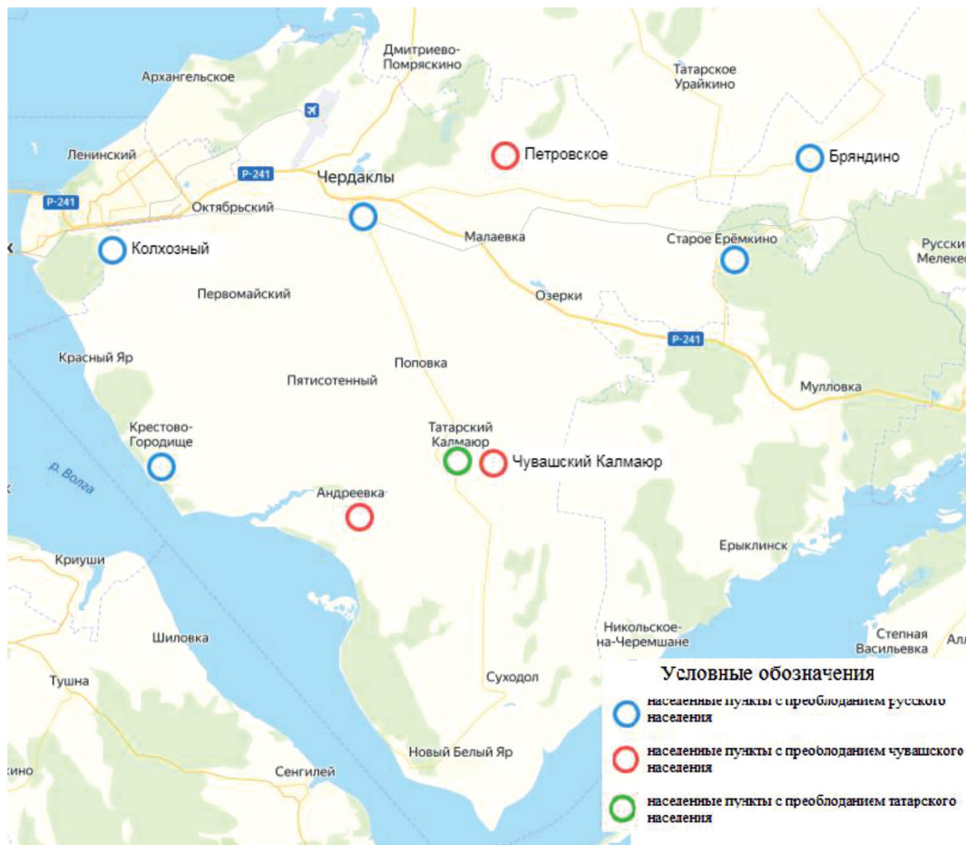
Рис. 2. Национальный состав некоторых населенных пунктов Чердаклинского района Ульяновской области в 2010 г. (составлено авторами)

Непосредственно подобные события предоставляют возможность восстановить взаимосвязь времен, вернуть этническую идентичность, утерянные ценности, вынуждают исследовать вопрос о том, что доставляло радость и тревожило наших предков, чем они занимались, как трудились, о чем мечтали, рассказывали, что передавали своим детям и внукам. Эффективность воспитательного влияния такого рода внешкольной работы возрастает при наиболее раннем привлечении обучающихся к проведению подобных событий.