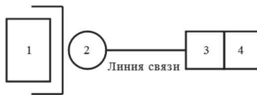
Рис. 1. Обобщенная структурная схема САОУН: 1 – объект контроля; 2 – первичный датчик контроля; 3 – устройство обработки информации; 4 – устройство индикации

Конструктивно САОУН должна содержать первичные преобразователи (датчики), размещенные в разных точках контролируемой среды, которые через каналы связи соединяются с устройствами обработки и отображения информации. В общем виде данную систему можно представить структурной схемой, изображенной на рис. 1.