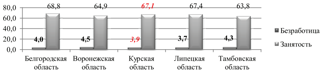
Рис. 1. Безработица и уровень занятости в Курской области на фоне областей Центрально-Черноземного района в 2014 г.

Численность занятых в экономике и безработных существенно отличается по отдельным образовательным уровням. В 2014 г. среди безработных граждан, проживающих на территории Курской области, была выше доля лиц со средним профессиональным образованием (53,5%).