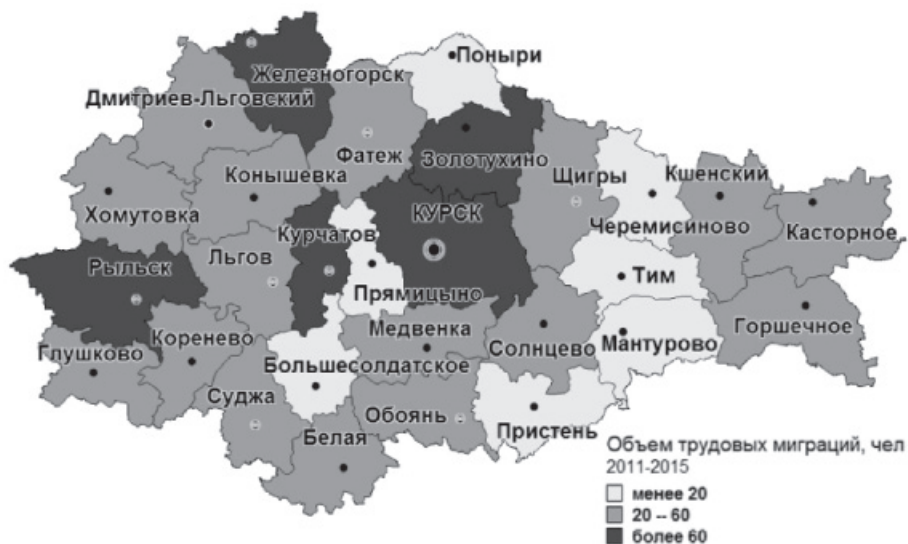
Рис. 4. Объем трудовых миграций населения Курской области в 2011–2015 гг.

Объем трудовой миграции в Курской области является одной из основных характеристик механического движения населения (рис. 4). За период с 2011 по 2015 г. он изменялся волнообразно: минимальным был в начале (2011 г. – 1815 чел.), максимальным в середине (2012–2014 гг. – 2102 чел.) и обнаружил нисходящие тенденции в конце периода (2015 г. – 1896 чел.). Изменение объема миграции населения зависит во многом от экономического потенциала региона, так как готовность мигрировать дает возможность оценить стремление к развитию.