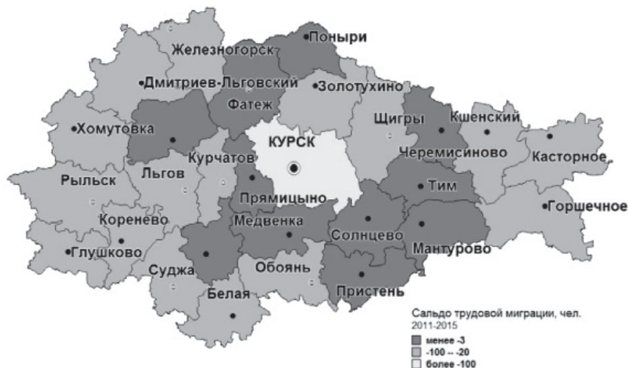
Рис. 3. Сальдо трудовых миграций населения Курской области в 2011–2015 гг.