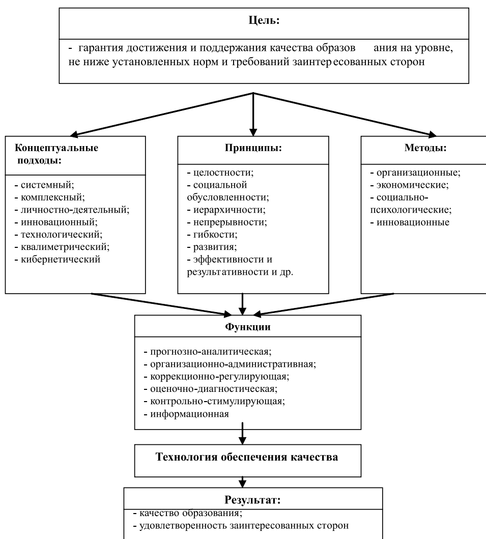
Рис. 1. Теоретическая модель внутреннего обеспечения качества в высшем образовании