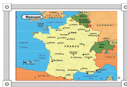
Рис. 2. Слайд 2