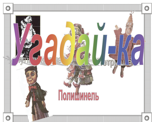
Рис. 4. Слайд 7

Звучит французская народная песня «Алюэтта». Дети поют её вместе с педагогом, а потом повторяют знакомые скороговорки. Педагог показывает слайды (4-6) с изображением Полишинеля и рассказывает о нем: «Полишинель одет в веселый карнавальный костюм и треуголку. Его огромные глаза, в зависимости от поворота куклы, выглядят то озорными, то сердитыми, то радостными. Он веселый и любит много поеть». Затем разыгрывает сценку «Знакомство» с перчаточными куклами.